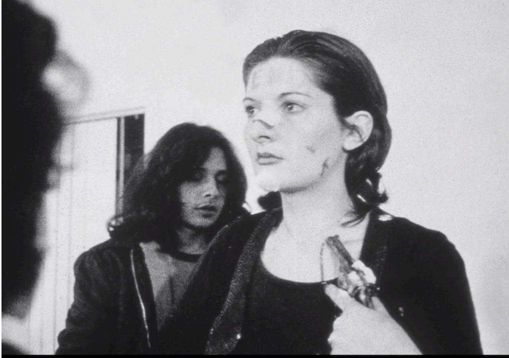
Şekil 1 Marina Abramović, "Rhythm 0" (1974)

etmesiyle ritüelistik hava ortadan kalkmış ve bu izleyicinin dehşete kapılarak performans mekanını terk etmesiyle nihayete ermiştir.