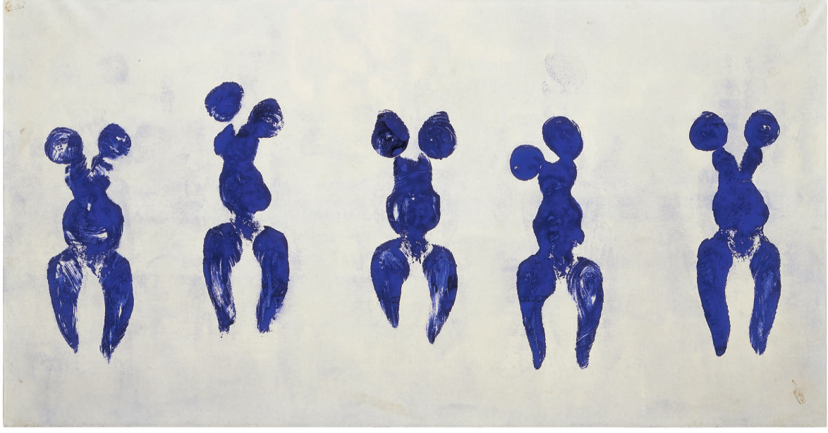
Şekil 4 Yves Klein, Anthropometry of the Blue Period, 1960