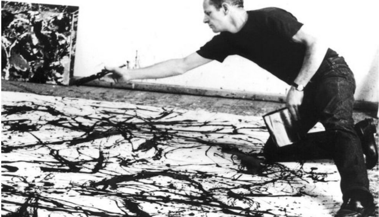
Şekil 3 Jackson Pollock, Action Painting , 1950

Yüzün dışına çıkan ve bir yüzleşme alanı haline gelen performans sanatı ve performatif bedenler aracılığıyla sergilenen eylemlilik alanı ritmik, ani, beklenmedik bir evren temasını güçlendirmektedir. Gündelik yaşam içerisinde dehşet ve şaşkınlık anlarını betimleyen bu haller rastlantısal görünümde belirmektedir. İnsan yapımı olan ancak insanın dışında kalan yapılanmalar terkedilerek bedenin dışavurumu kendini göstermeye başlamıştır. Beden hareketlerini takip eden “ Action Painting ” ya da benzer biçimde bedenlerin tuvaler üzerindeki hareketlerini kaydeden yeni tarzları daha çok dehşet veren kanlı yapılar izlemiştir.