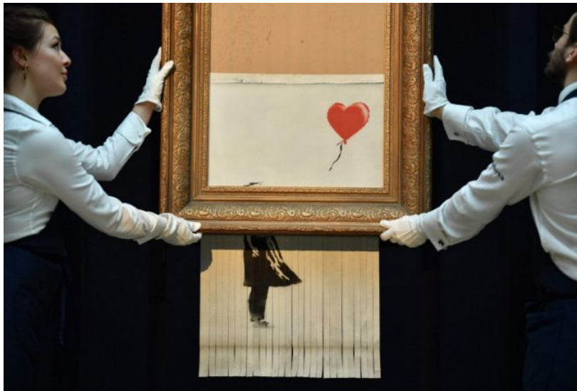
Şekil 6 Banksy, Girl with Balloon – Parçalanmış , 2018

Performatif bedeninin izleyiciyle olan sınırlarını alaşağı etmesi ve onu bir anda avlaması artık kendisini sokaktaki sanat formlarıyla yapmaktadır. Yaklaşık 10 yıllık bir zaman dilimi boyunca sanatını sokaklarda bedenlileştiren ve protest bir imge olarak sergileyen Banksy bunun en iyi örneklerindendir. Tüm dünyada bilinen Balonlu Kız eserini, Sotheby müzayede evinde açık arttırmayla 1.1 milyon dolar gibi büyük bir rakama satıldıktan sonra, tablo içindeki bir mekanizmaya parçalatması büyük yankı uyandırmıştır. Sanat eserlerinin inanılmaz yüksek fiyatlara satılmasını protest bir imge olarak kullanan Banksy, eserin sanatçıdan olan bağımsızlığına ve onun olmaksızın yok oluşuna önemli bir imgelemi ortaya koymuştur. Banksy'nin tavrı göz önünde bulundurulduğunda yadırganmayacak olan bu tavır gerilla sanatın en iyi örneklerindendir. İktidar ya da egemenin öngördüğü kontrol mekanizmaları ve şiddet yönelimi performatif beden karşısında etkisizdir. Banksy bunun en iyi örneklerinden biridir. Özellikle gerilla tarzıyla özdeşleşen performatif beden iktidarın mekânında çarpık eylemlerini gerçekleştirerek eşik konumunu güçlendirmektedir. Böylece yontulmuş bedenler arasında performatif olanın açtığı boşluk ve dipsizliği destekleyen tekinsizlik durumunu kavrarız.