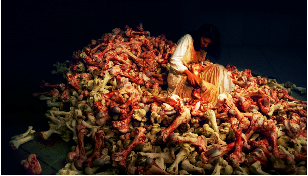
Şekil 5 Marina Abramović, Balkan Baroque, 2000

Performans sanatçılarının kendi bedenleri üzerinde yaptığı sınırları zorlama eylemleri performans sanatını anlama konusunda oldukça ufuk açıcudur. Bu performanslarda “üreten sanatçı” ve “üretilen eser”in birbirlerinden ayrıştırılamaz oluşu sanatçı-beden ilişkisini yeniden düşünmek açısından temel bir alan oluşturur. Sanatçı kendi “eserini” tamamen kendine özgü